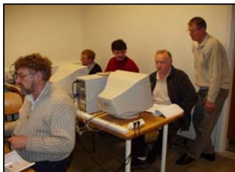
Budskabet når bagerste række.