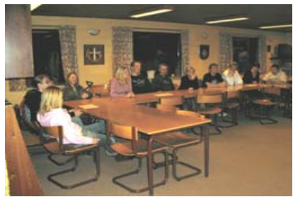
Øv – det er ligesom i skolen