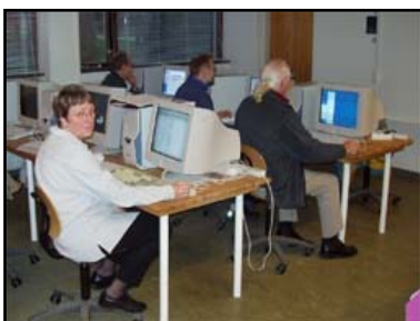
Hvem sidder der bag skærmen ?.