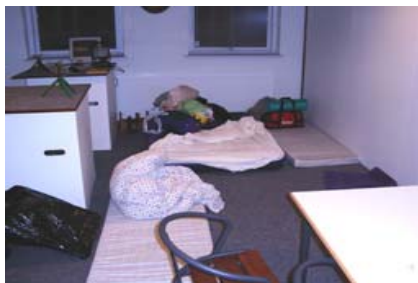
Kl. er 02.00 hvor er de henne?