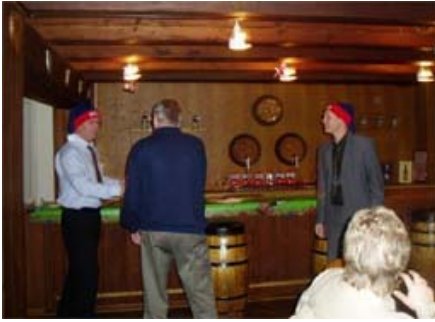
Ølnisserne deler gaver ud.