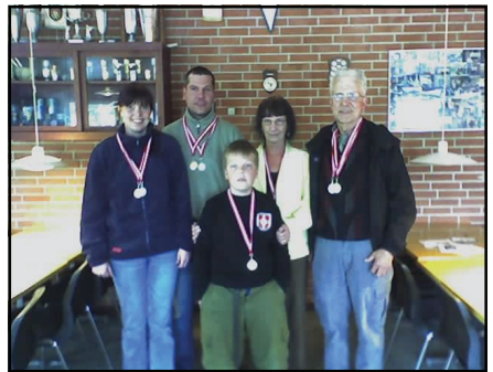
Randers 2 fik sølv