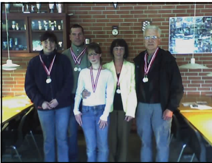
Randers 1 fik guld